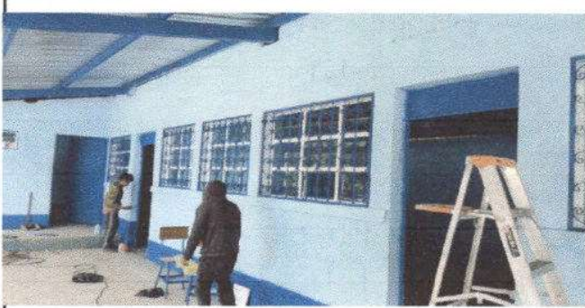
Foto 3: MANTENIMIENTO A ESTRUCTURAS (LIJADO, SUGECIONES, Y APLICACIÓN DE PINTURA) 4