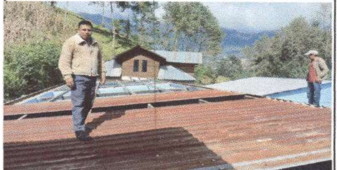
Foto 2: SUSTITUCION DE LAMINA POR LAMINA TROQUELADA ALUZINC, CALIBRE 26. UN TOTAL DE 209 M2