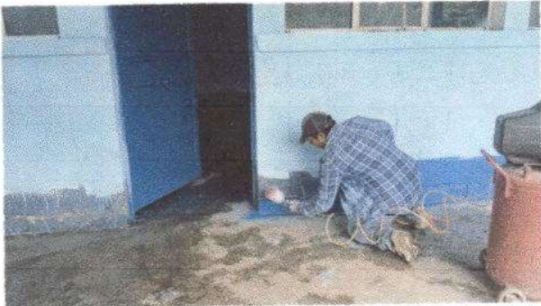
Foto1: PINTURA EN MUROS EXTERIORES E INTERIORES, 400 m2.